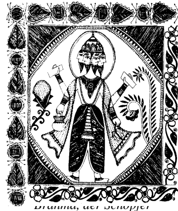
Brahma, der Schöpfer

Etwas ab 1000 kommt es zum Brahmanismus. Der Priester bekommt mehr Macht, er kennt die Opferrituale; in den Brahmanas sind diese niedergeschrieben. Um 600 etwa entstehen die Upanishaden (Geheimlehren), die in Form von Dialogen nach dem innersten Wesen von Welt und Mensch fragen. Späteren Perioden (600-300 v.Chr) gehören zwei Epen (Ramayana und Mahabharata) sowie die Bhagavadgita an. Die Bhagavadgita ist der Versuch, alle Lehren der großen Schulen und alle Regeln der Hindumoral mit dem gewöhnlichen Leben des einfachen Hindu zu vereinen.